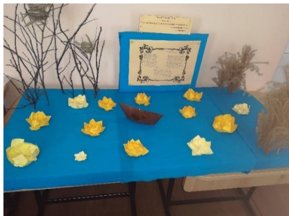
(Machete realizate după poezia „Lacul” de Mihai Eminescu)