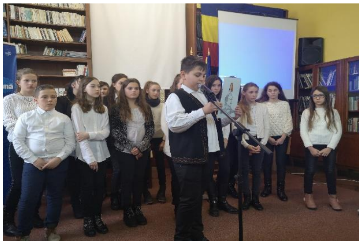
(Programul artistic susținut la Biblioteca Județeană Satu Mare)

În concluzie, lucrarea de față punctează câteva dintre modalitățile de realizare și implementare a proiectelor extracurriculare de interes local care urmează a fi cuprinse în calendarul activităților educative județene prin parcurgerea unor pași, precum: redactarea proiectului educațional; întocmirea raportului narativ care cuprinde descrierea activităților derulate și imagini de la aceste activități; realizarea parteneriatului și transmiterea de informații întocmite la solicitarea inspectorului de specialitate.