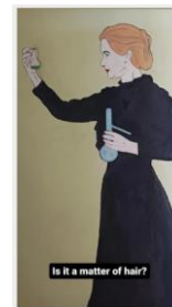
Fig. 2 - Învățătoarea - Afișul elevilor români Fig. 3 - Marie Curie - pictura elevilor greci

În ultima activitate, s-a înregistrat un cântec: No more silence . Cântecele a fost compus de către elevii și profesorii din Grecia, iar interpretarea a fost realizată împreună de către elevii din România și Grecia (Anexa 3).