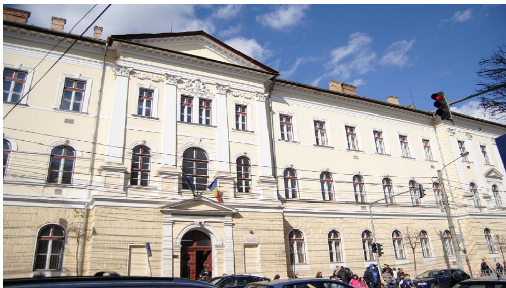
•fig.2-Clădirea actuală a liceului•

Liceul este situat pe strada Avram Iancu la numărul 33, lângă Turnul Croitorilor și statuia lui Baba Novac. Intrarea în clădirea liceului se face atât din strada Avram Iancu, calea de acces principală, cât și utilizând poarta secundară de pe strada Baba Novac de unde se pătrunde în curtea interioară, recent înnobită de bustul lui Gheorghe Șincai, patronul spiritual al instituției de învățământ.