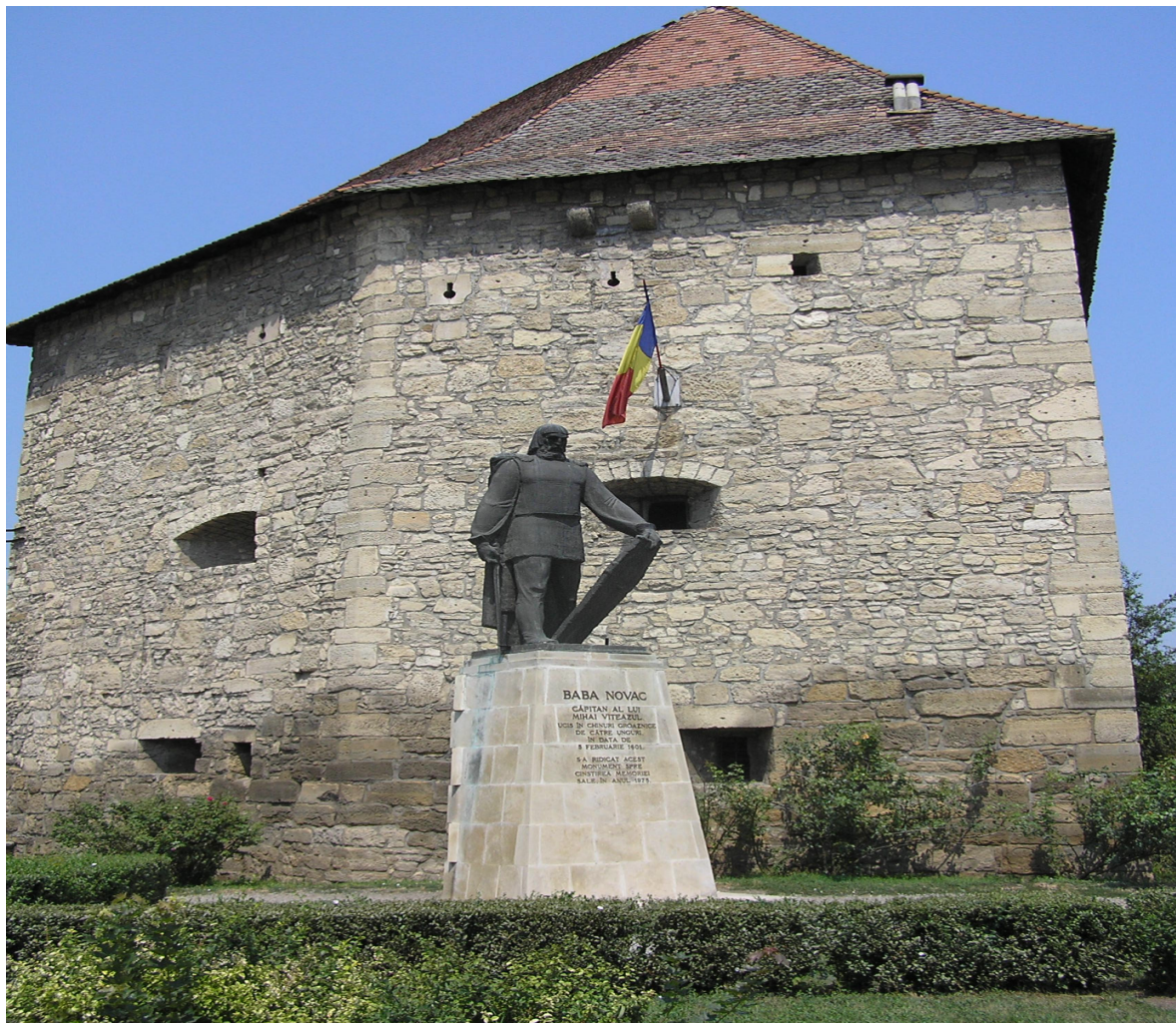
Fig. 3: Statuia de lângă bastion, ridicată în cinstea lui Baba Novac