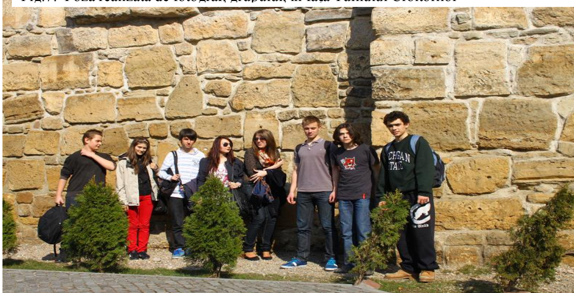
Fig.7: Poză realizată de fotograf, grupului, în fața Turnului Croitorilor