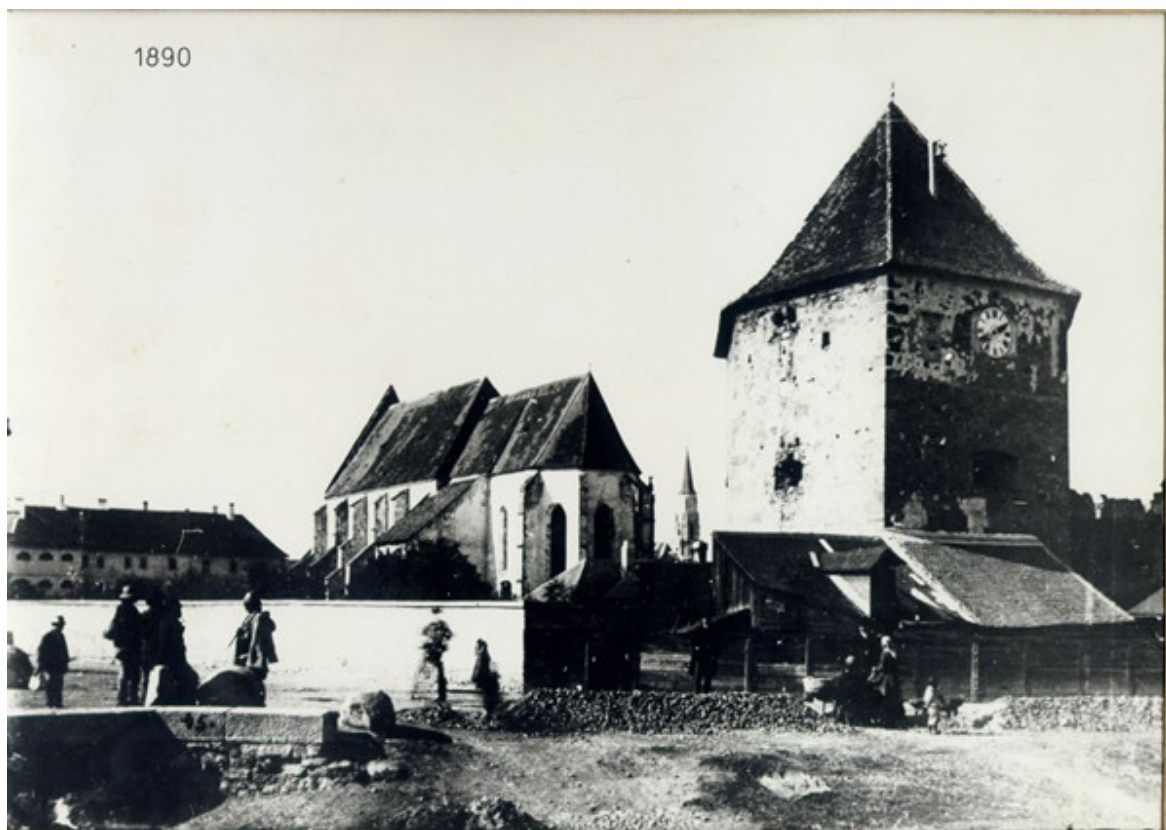
Fig. 1: Bastionul Croitorilor în anul 1890

Bastionul reprezintă colțul de Sud-Est al cetății medievale ridicate începând cu secolul al XV-lea (este amintit deja în anul 1475). Între anii 1627-1629, în perioada principelui Gabriel Bethlen bastionul a fost reconstruit, ajungând la forma actuală. Este construit din piatră fălțuită zidurile masive păstrând încă lăcașurile de tragere. Spre nord, lipit de el, se mai păstrează încă o bucată din zidul de piatră cu creneluri și drumul de strajă pe zid.