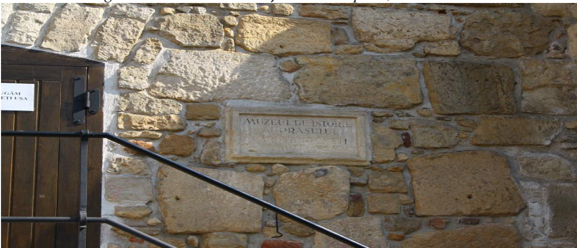
Fig. 6: Tăblița de la intrarea în bastion

- lângă intrare este scris pe o tăbliță: „MUZEUL DE ISTORIE AL ORĂȘULUI”. Același lucru scris în maghiară scris dedesubt este șters în mare parte;