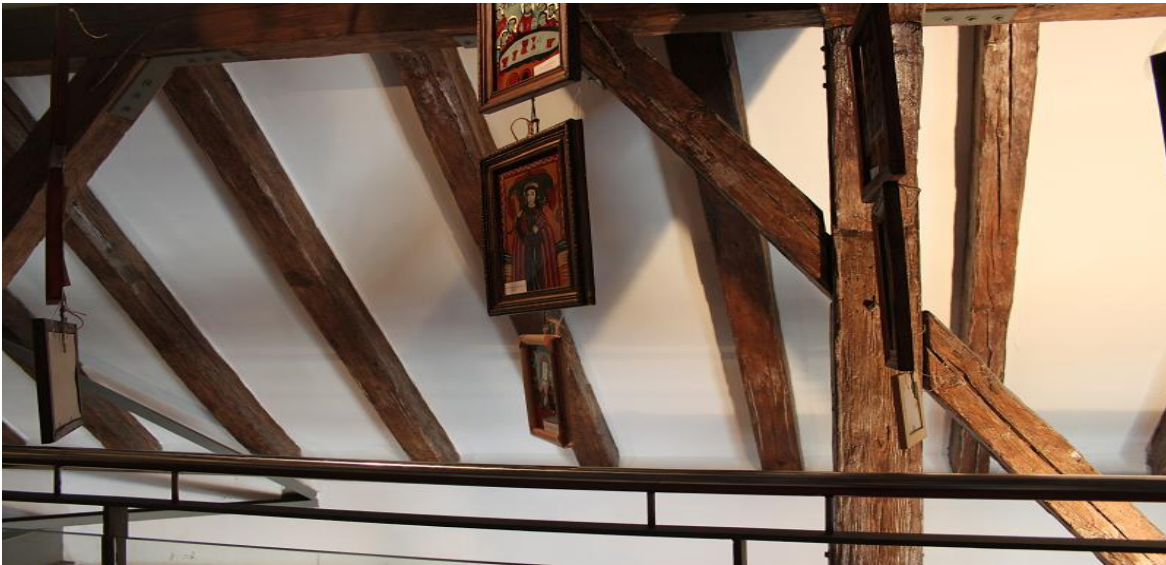
Fig. 5: Icoană pictată pe sticlă

7.03.2012:- discuții legate de organizare;