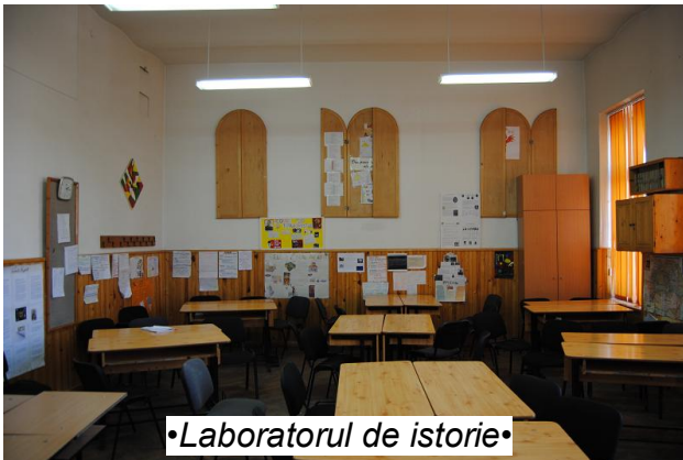
•Laboratorul de istorie•

săli multimedia, 18 cabinete (din care unul de