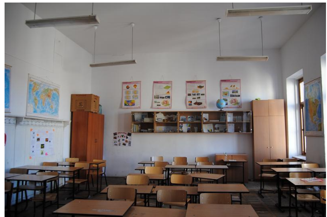
•Laboratorul de geografie•