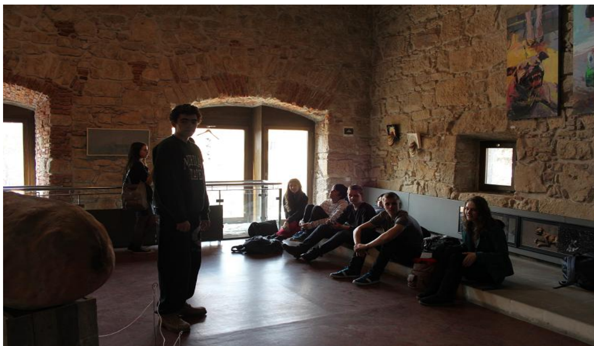
Fig. 4: Membrii echipei în timpul vizitei pe teren, în interiorul bastionului