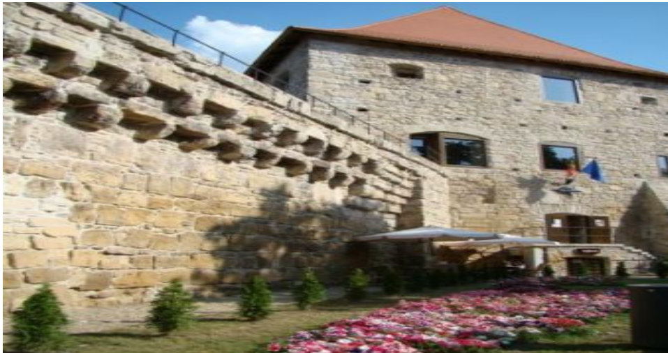
Fig. 2: Tumul Croitorilor după renovare (imagine preluată de pe site-ul http://www.citynews.ro/cluj/eveniment-29/cavaleri-donnite-si-strajeri-la-bastionul-croitorilor