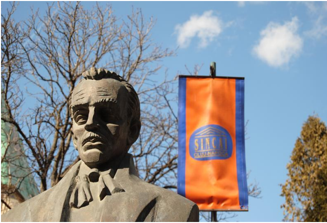
•fig.3-Bustul lui Gheorghe Șincai• psihologie), 6 laboratoare, o bibliotecă, o sală de sport, un teren sintetic de fotbal, un teren de baschet, un spațiu de joacă și o capelă.